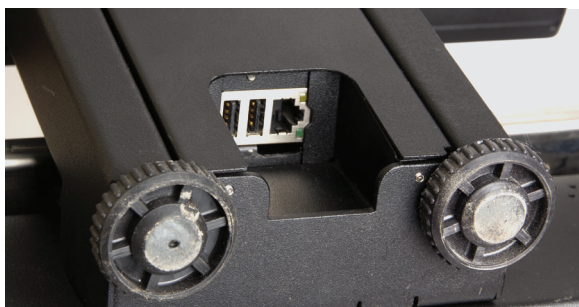
Ethernet и 2 USB-порта в стандартной комплектации